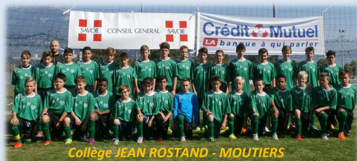
Collège JEAN ROSTAND - MOUTIERS