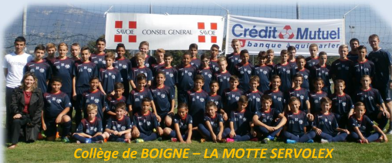
Collège de BOIGNE – LA MOTTE SERVOLEX