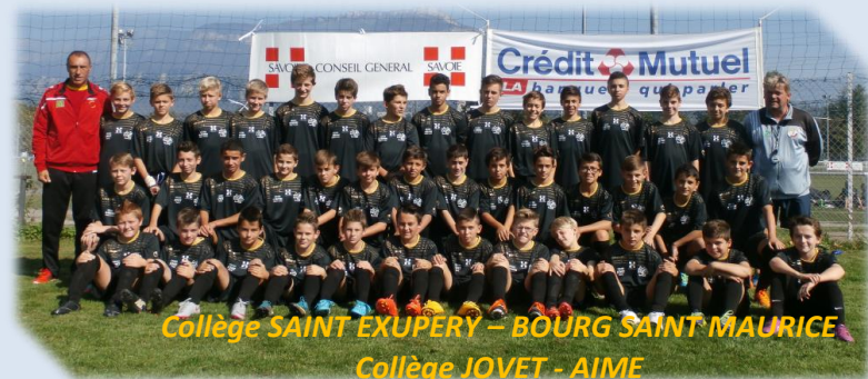
Collège SAINT EXUPÉRY – BOURG SAINT MAURICE Collège JOVET - AIME