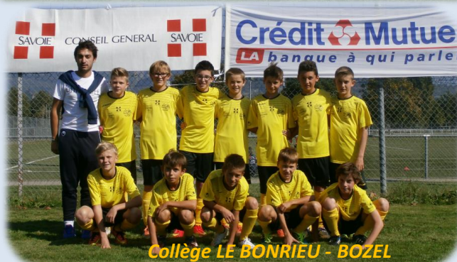
Collège LE BONRIEU - BOZEL