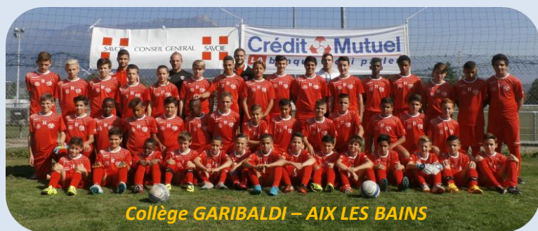
Collège GARIBALDI – AIX LES BAINS