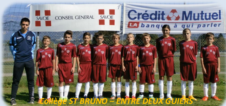
Collège ST BRUNO – ENTRE DEUX GUIERS