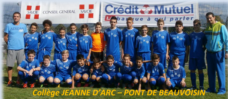
Collège JEANNE D'ARC – PONT DE BEAUVOISIN