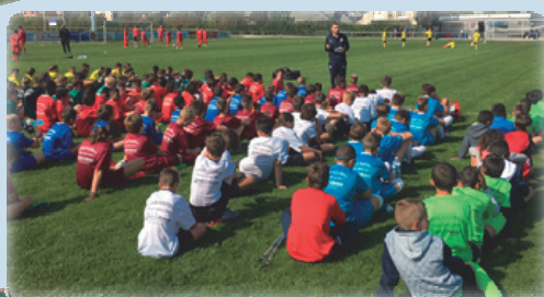
Les PES (Parcours d'excellence sportive)