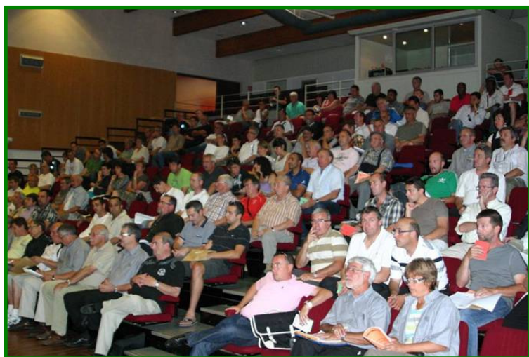
Une assistance studieuse et attentive

Prochain rendez vous avec l'assemblée générale de rentrée qui aura lieu le vendredi 26 août à Laissaud