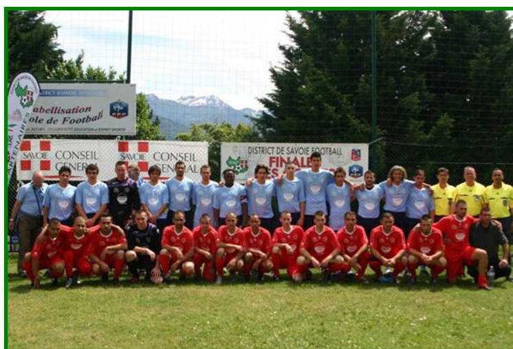
ES Tarentaise B (bleu) AF Montmélián B (rouge)