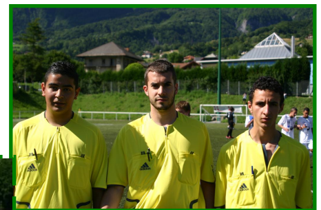
Les trois arbitres finale cadets

Le District de Savoie remercie les municipalités pour le prêt des installations et les clubs pour leur accueil