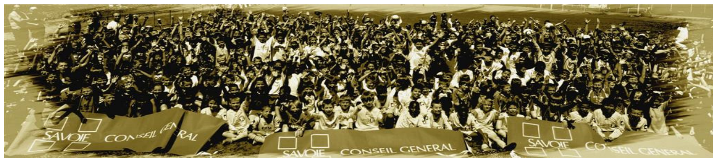
JOURNÉE NATIONALE DES PUPILLES A CHAMBÉRY

Lettre d'information mensuelle du District de Savoie de Football - N° 10 – Juin 2011