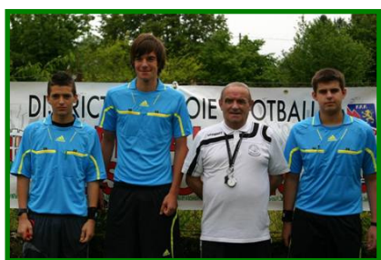
Les trois arbitres

SO Chambéry (blanc), Nivolet (rouge), Drumettaz (bleu) (pupilles)