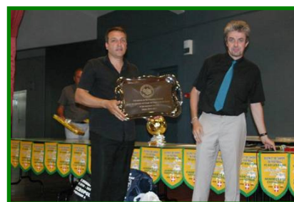
Récompense remise au président du SOC

Remerciements à la municipalité de Cognin et au club de Cognin Sports.