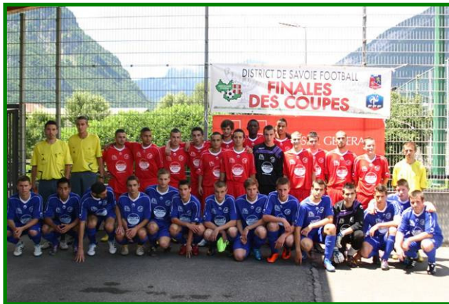
UO Albertville (en rouge) Le Pont de Beauvoisin (en bleu)