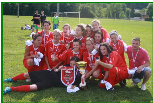
FC Haute Tarentaise (vainqueur)