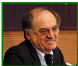
Noël Le GRAET