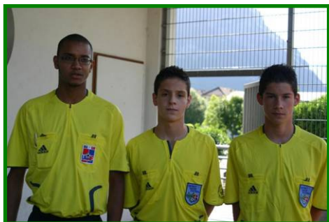
Les trois arbitres finale minimes