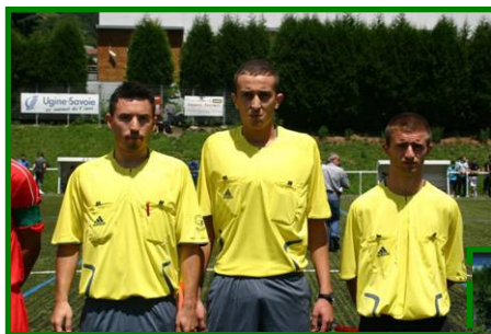
Les trois arbitres finale juniors