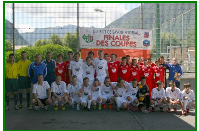
FC Nivolet 2 (en blanc) FC Mercury (en rouge)