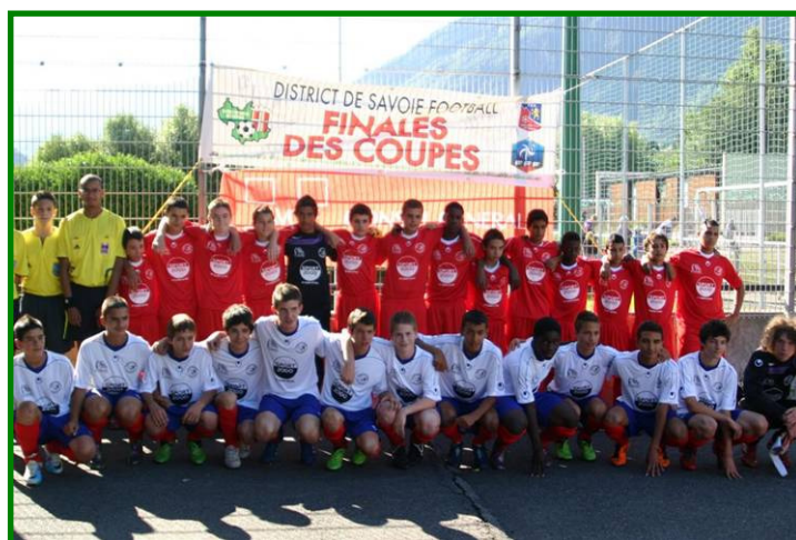
ES Drumettaz (en blanc) UO Albertville (en rouge)