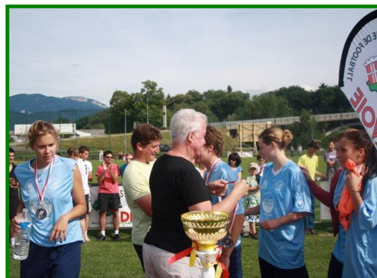
ES Tarentaise (finaliste)