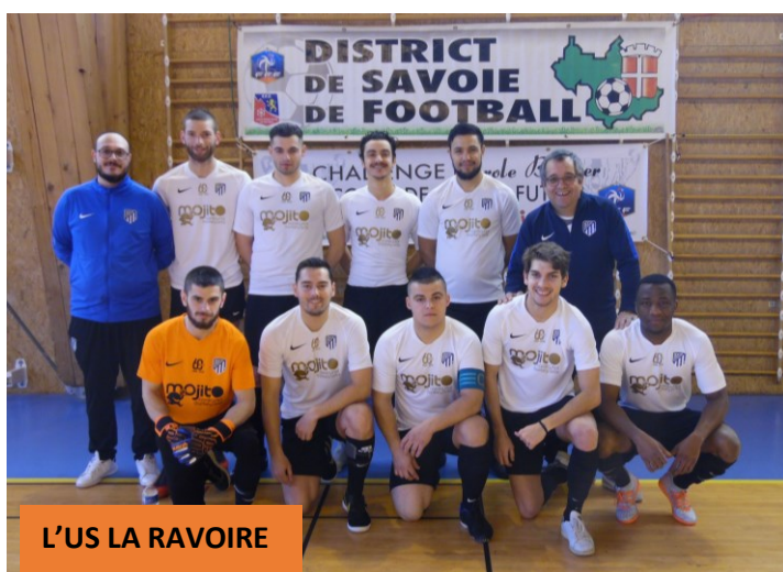
L'US LA RAVOIRE

Victoire de l'US LA RAVOIRE sur le score de 7 à 5. Belle rencontre avec de nombreux buts