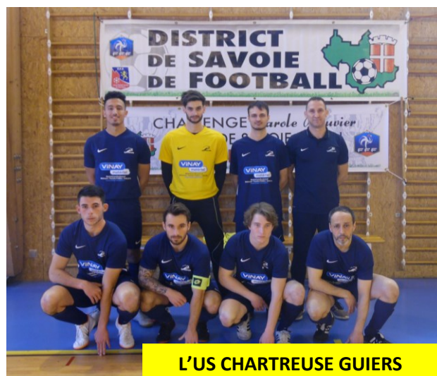
L'US CHARTREUSE GUIERS