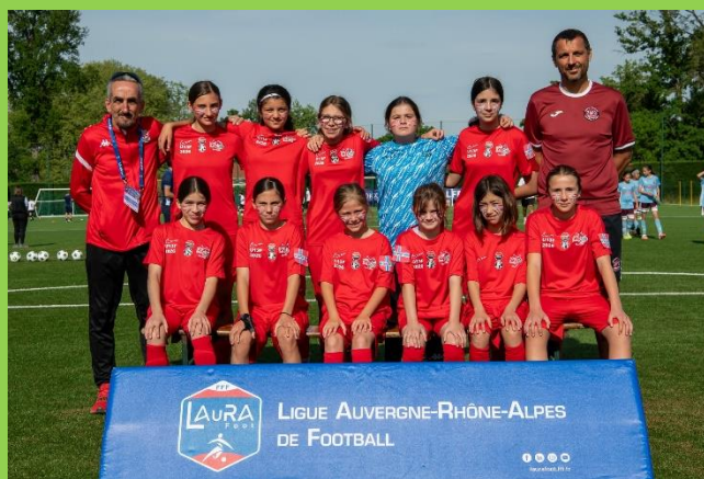
L'ENTENTE G.A.P.S. – US DOMESSIN (U13F)