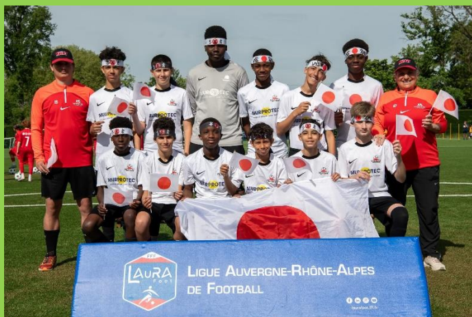
FC NIVOLET (U13G)

Félicitations au FC NIVOLET (U13G) qui termine sur le podium du FESTIVAL U13 PITCH REGIONAL et à l'ENTENTE G.A.P.S. – US DOMESSIN (U13F).