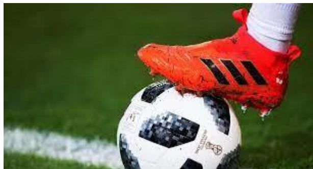
Tableau du statut d'arbitrage en annexe de ce Foot Savoie